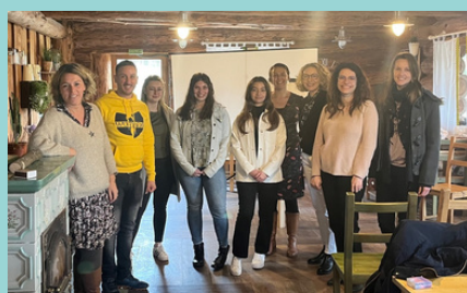
Une journée avec Propulse : Travail sur la communication avec un focus sur les valeurs partagées.

Nous construisons notre équipe chaque jour pour vous servir au mieux !