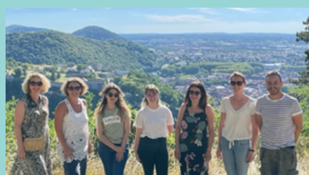
Un soir à Besançon avant la pause estivale