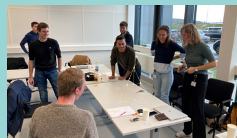
Atelier Créativité et Innovation : Séance de travail avec un de nos clients à l'international