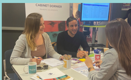
Participation au Grand Forum Emploi Diversité RH & RSE : emploi et inclusion, un enjeu économique et social.