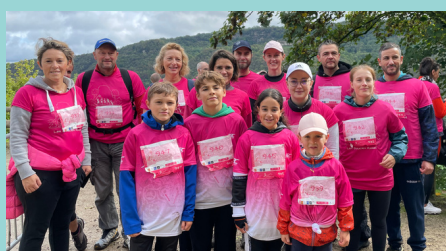
Participation en famille aux Boucles Roses